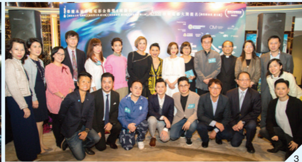
信義會《黃金花》明星慈善場已於3月27日九龍塘又一城 Festival Grand Cinema 順利舉行。

是次活動籌得之款項，將用作支持本機構康復服務。《黃金花》導演陳大利與多位主要演員如毛舜筠*、凌文龍*、余安安等均現身支持，機構代表亦聯同電影導演及主要演員，於電影放映後答謝觀眾支持及分享關於智障人士照顧者面對的困難和壓力。